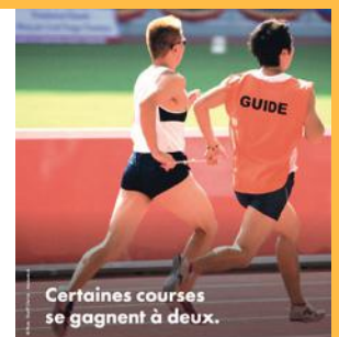
Les avocats représentent et protègent aussi les sportifs pour faire valoir leurs droits. Ils accompagnent les personnes en situation de handicap pour l'égalité des droits au sport. Ils luttent contre les discriminations pour l'égalité et l'inclusion. Trouvez et consultez votre avocat sur avocats.fr