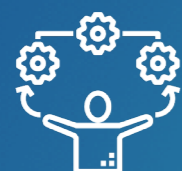
DÉLÉGUÉS À L'INFORMATION