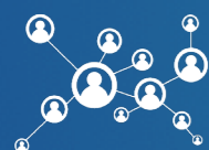
MEMBRES DE LA DÉLÉGATION