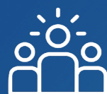
CHEFS DES DÉLÉGATIONS

i Cette partie du kit de bienvenue explique les principaux rôles de différents postes au sein du CCBE. Elle est donnée uniquement à titre d'information et doit être lue conjointement avec les statuts et le règlement d'ordre intérieur du CCBE.